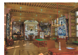
Zaal van de koning, gerestaureerd in de staat van 1652.

De bekwame en ambitieuze Jean-Louis wordt al snel opgemerkt en aan het hof opgenomen. Hij wordt kolonel-generaal van de infanterie, heeft de legers in handen, bestuurt strategische provincies en vergaart fortuin, eer en haat. In 1587 trouwt hij met Marguerite