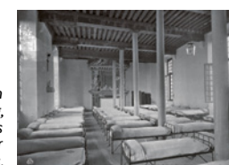
Zaal van de koning, gebruikt als slaapzaal door de gevangenis.

In 1818 koopt de staat het kasteel aan om er het eerste centrale tucht- en correctiehuis voor vrouwen in Frankrijk te vestigen. De redenen voor opsluiting variëren van kruimeldiefstal tot geweldsmisdrijven (waaronder veel kindermoord, vaak door misbruikte