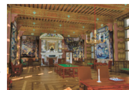
Sala del rey, restitución en su estado de 1652.

Hábil y ambicioso, Jean-Louis pronto destaca y se instala en la corte. En 1581, Enrique III lo hace duque de Épernon y Par de Francia. Coronel general de la Infantería, controla los ejércitos, gobierna provincias estratégicas, y acumula fortuna, honores y odio. En