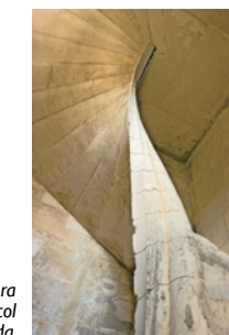
Escalera de caracol suspendida.

En el sótano, las salas sirven de refectorio para la cárcel, dos siglos después de haber alojado las cocinas del castillo y el taller donde Claude de Lapiere, maestro tapicero, tejió la colgadura de La Historia de Enrique III . La estancia de ecos consecutiva, cocina para la cárcel, presenta una notable acústica que corre a lo largo de la bóveda, antes de una sutil escalera oculta, de caracol suspendida. Conectaba el edificio del sótano hasta el ático, acondicionando un recorrido discreto entre las plantas.